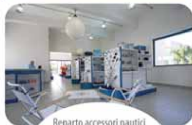
Reparto accessori nautici