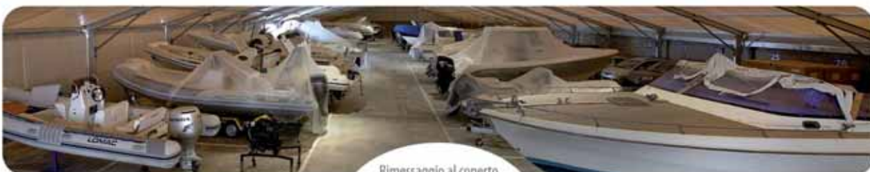
Rimessaggio al coperto

Foti Marine Via Acquevole 117 | Milazzo (ME) | Info e Prenotazioni | 0909233111