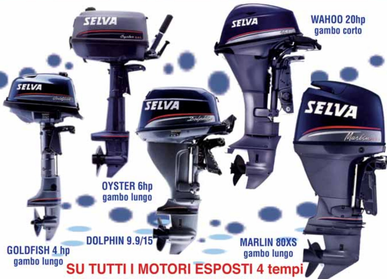
WAHOO 20hp gambo corto

e-mail: commerciale@tyndarisbymotomare.it - www.tyndarisbymotomare.it