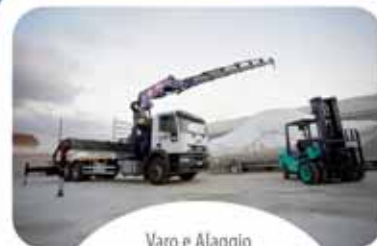
Varo e Alaggio